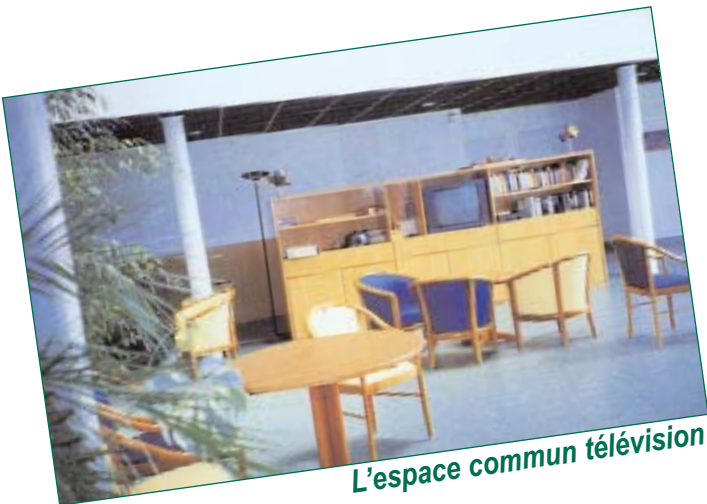
L'espace commun télévision