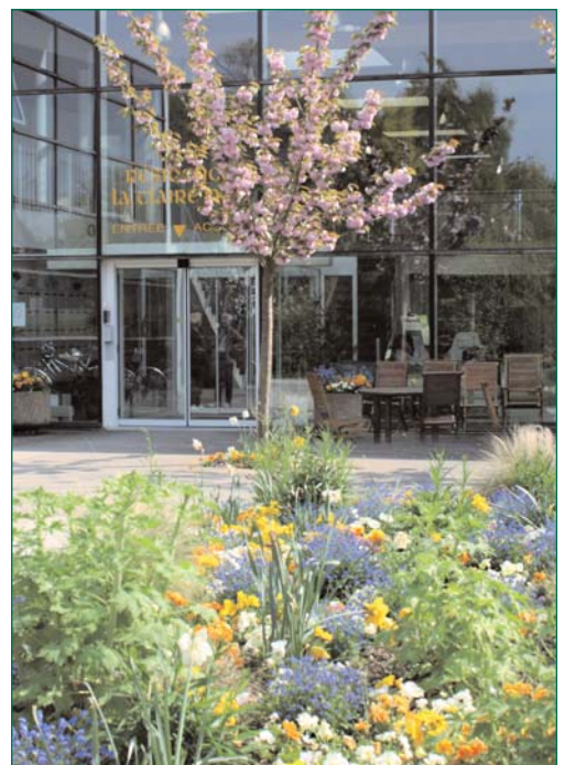
Terrasse à l'ombre

Vous avez la possibilité de prendre des repas à l'extérieur mais aussi de recevoir des invités dans le salon voisin de la salle à manger. A cet effet, il vous est demandé de prévenir le secrétariat 48 heures à l'avance.