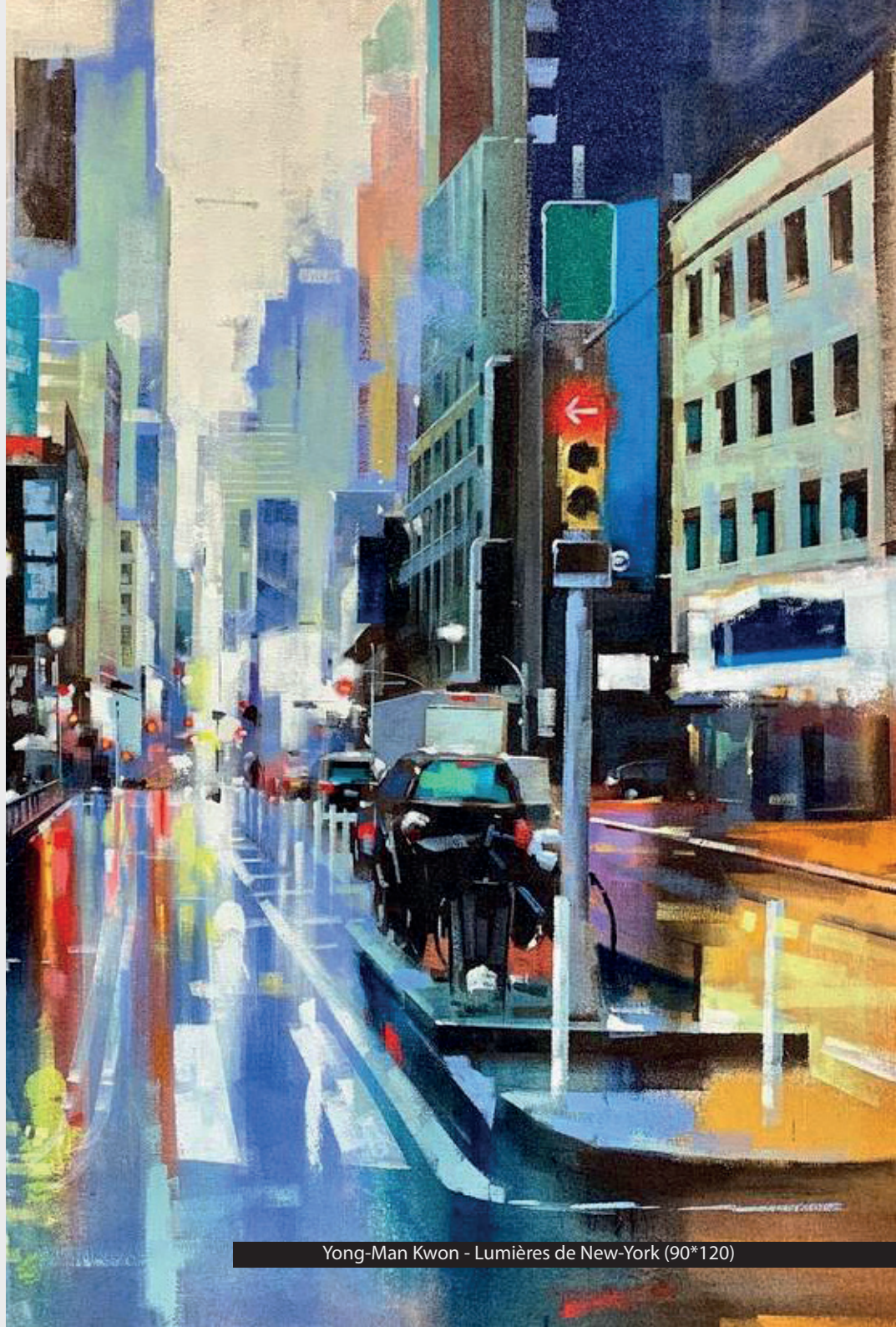
Yong-Man Kwon - Lumières de New-York (90*120)

S'il tire de ses titres officiels de nombreux « portraits » à l'huile de bateaux ou d'avions, le regard de Yong-Man Kwon est tout aussi juste lorsqu'il est question de portraits, de tableaux animaliers ou de paysages : ses compositions urbaines brillent de mille feux, ses intérieurs portent en eux juste un soupçon de nostalgie solennelle.