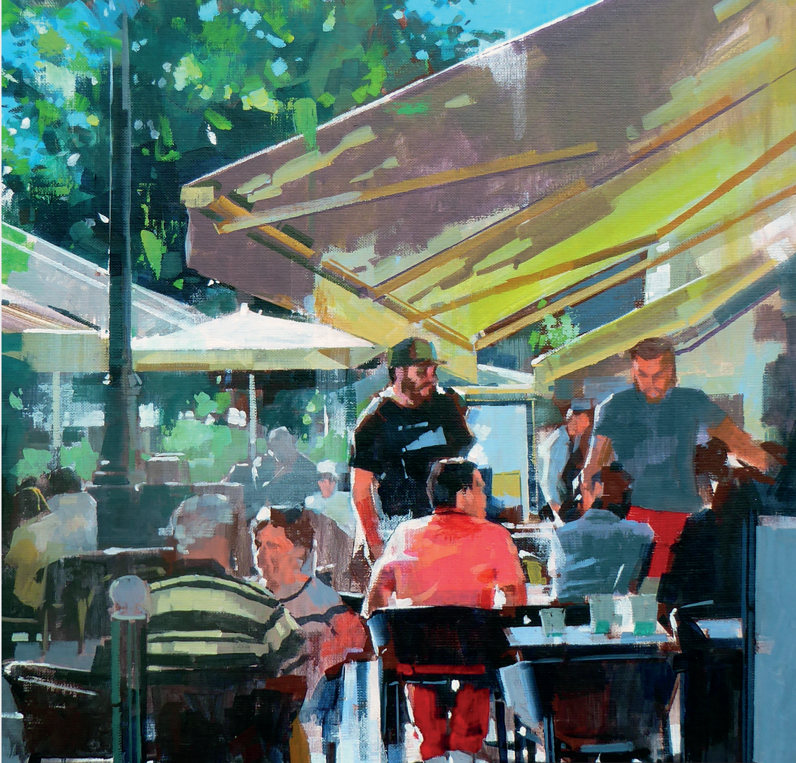
Yong-Man Kwon - terrasse (61*46)