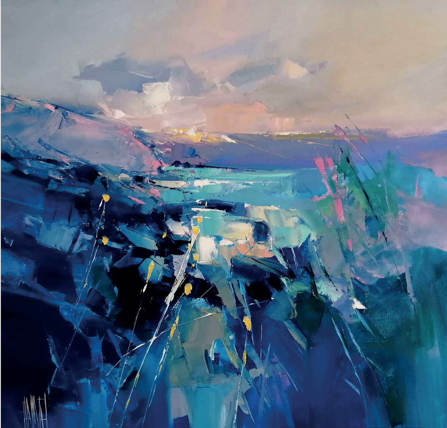
Hervé Lenouvel - En bais d'Ecalgrain (60*60)