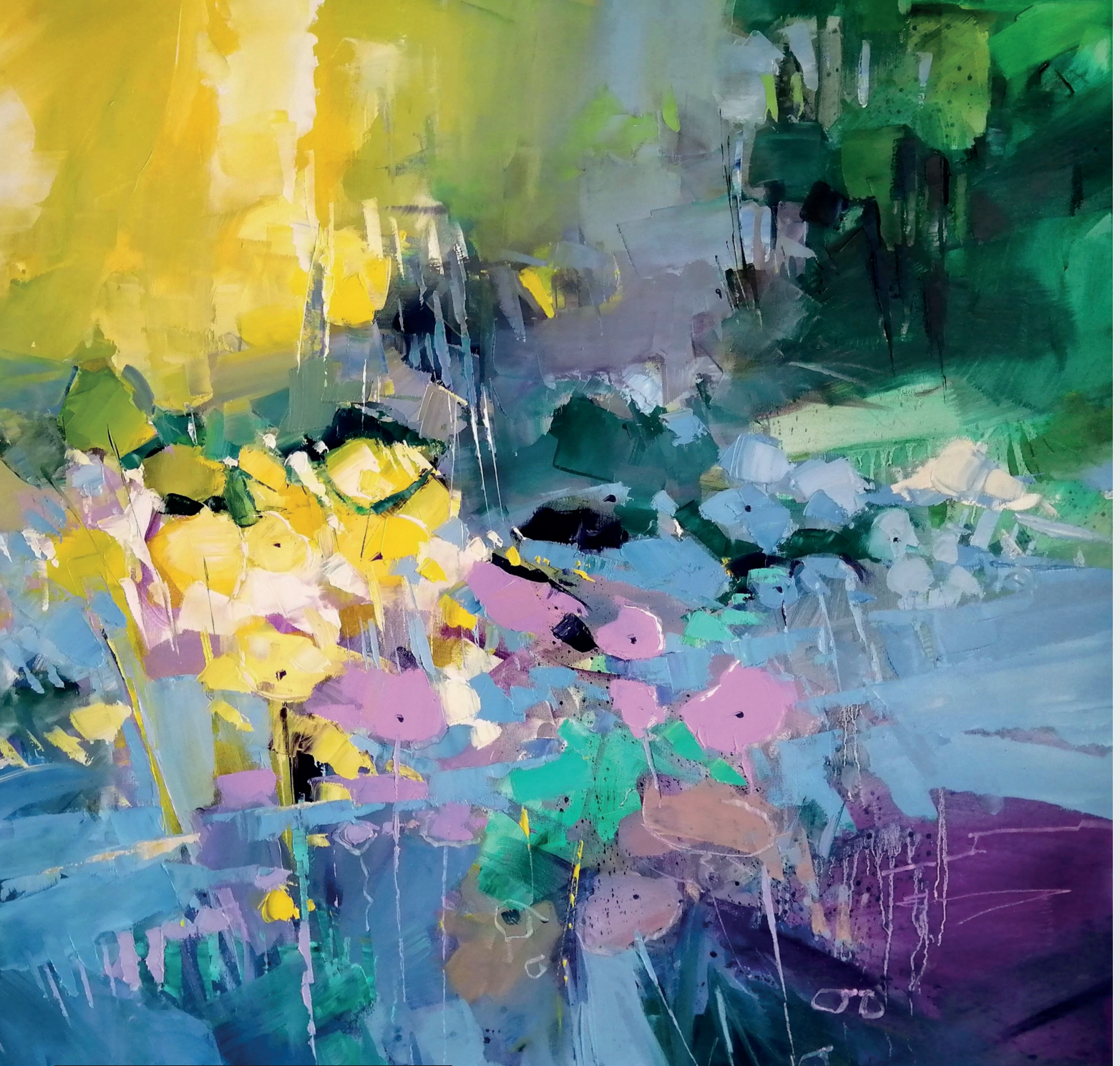
Hervé Lenouvel - Floraison au bois (80*80)