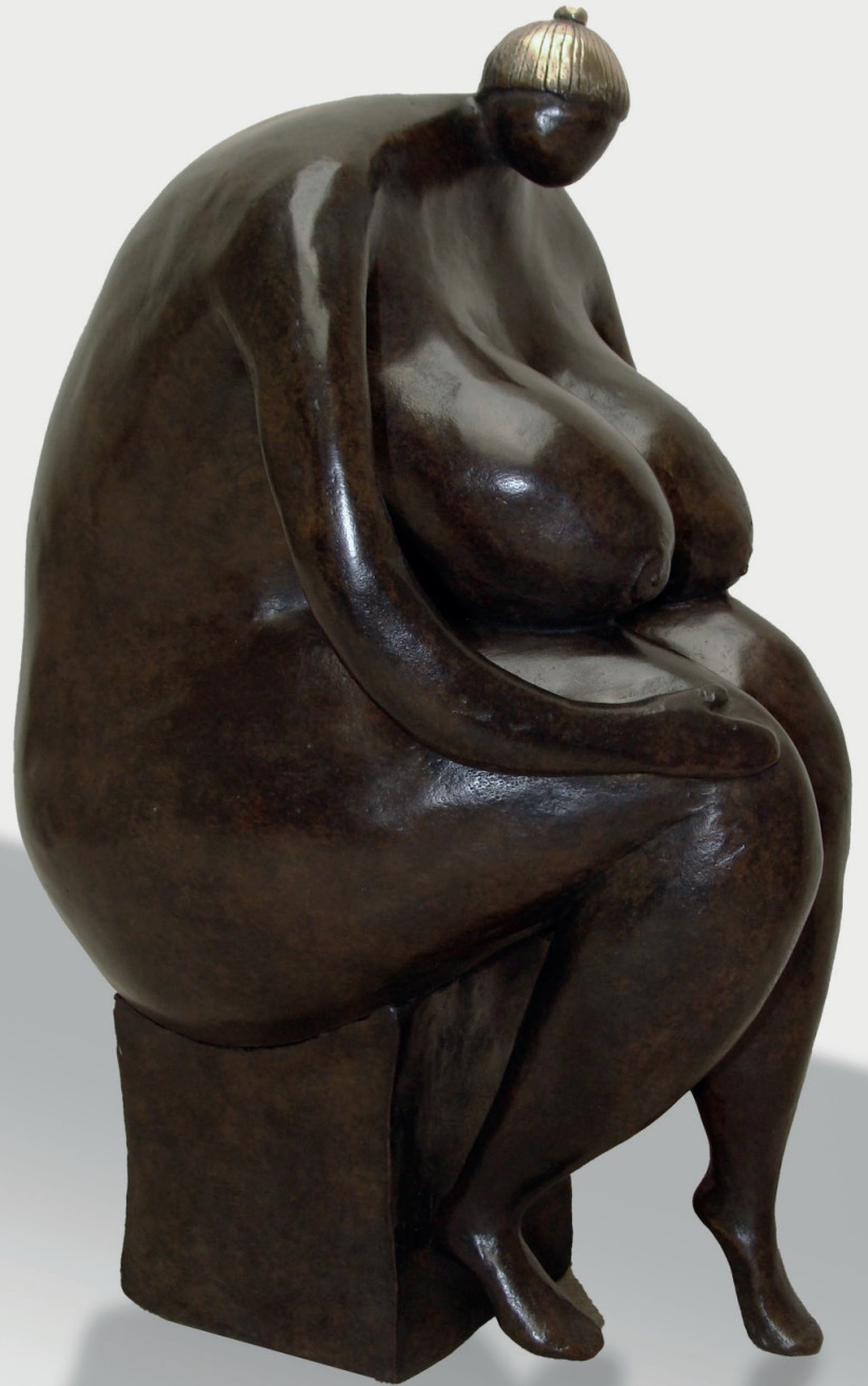
Annie Hamon - Mater Fructuosa - Bronze (32cm)