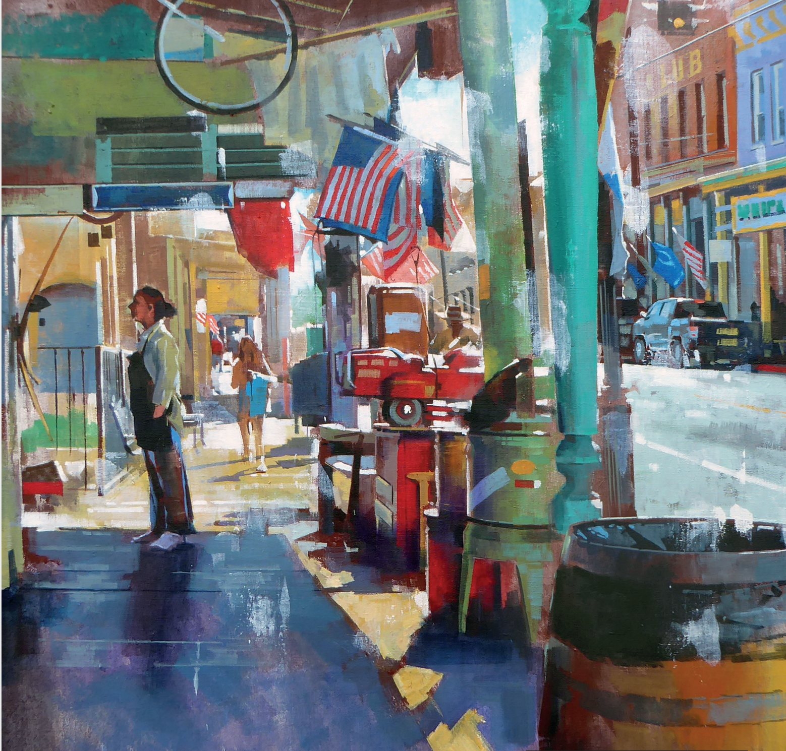
Yong-Man Kwon - Magasins(100*81)