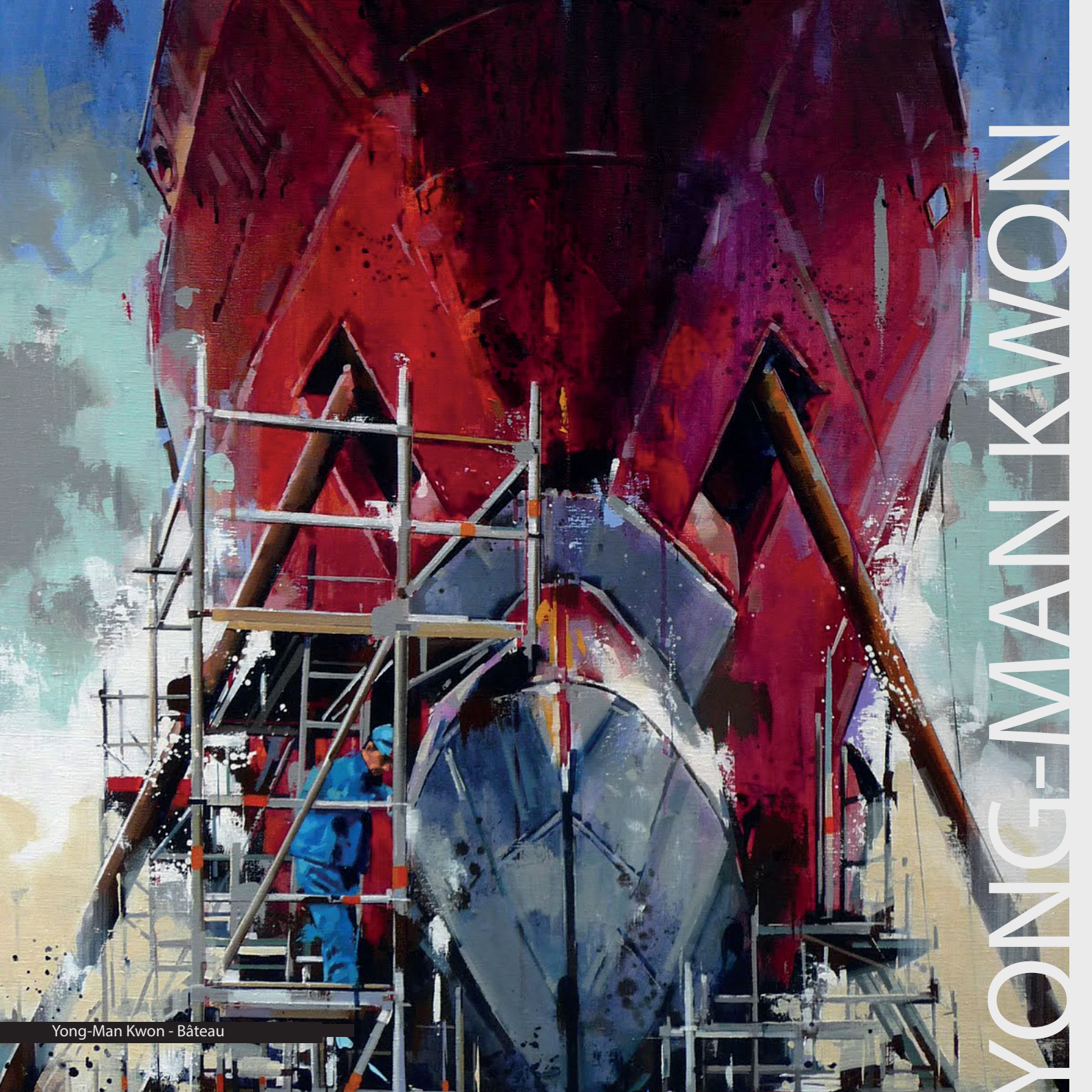
Yong-Man Kwon - Bateau