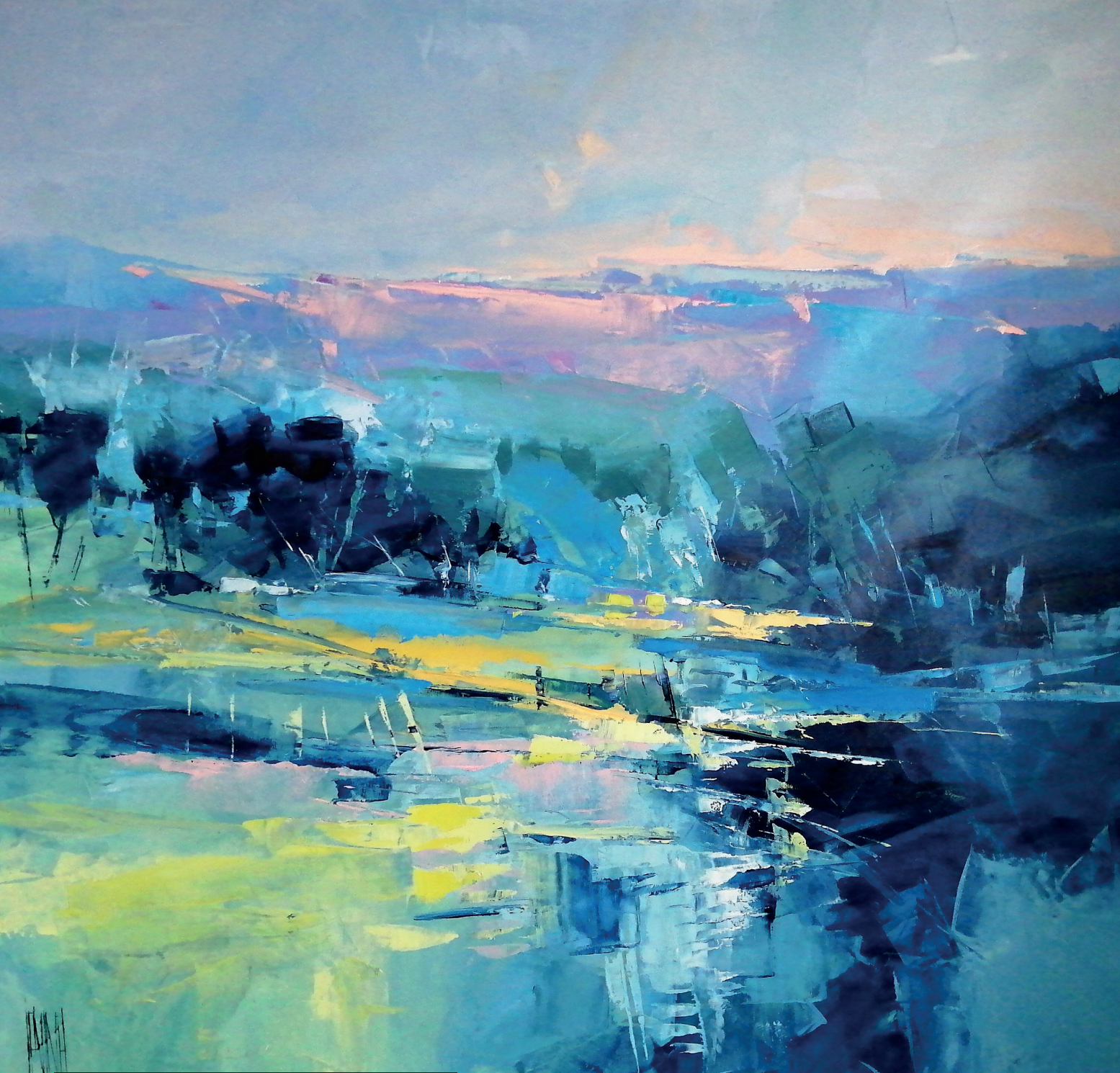
Hervé Lenouvel - le grand pré (100*100)