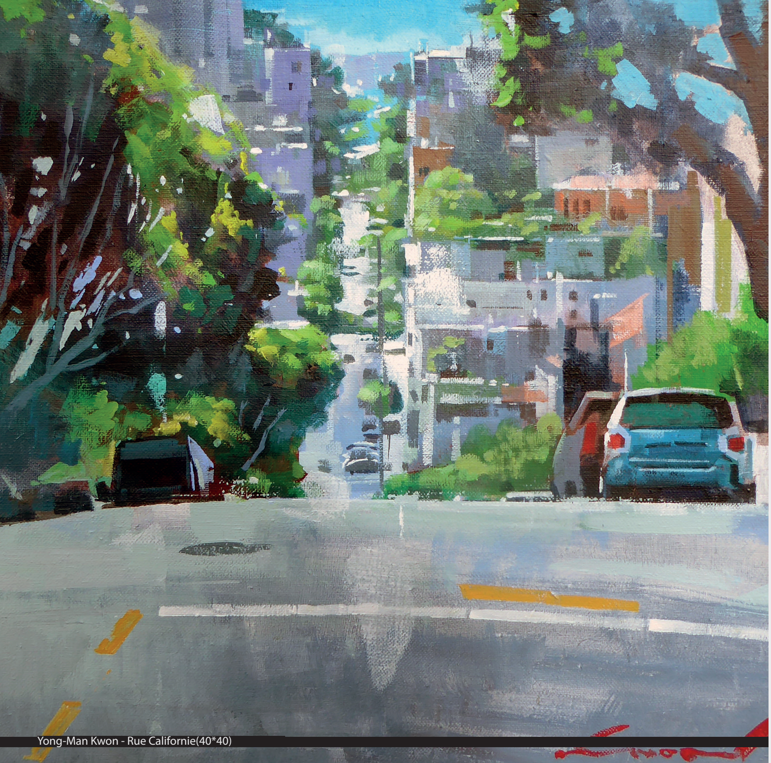
Yong-Man Kwon - Rue Californie(40*40)