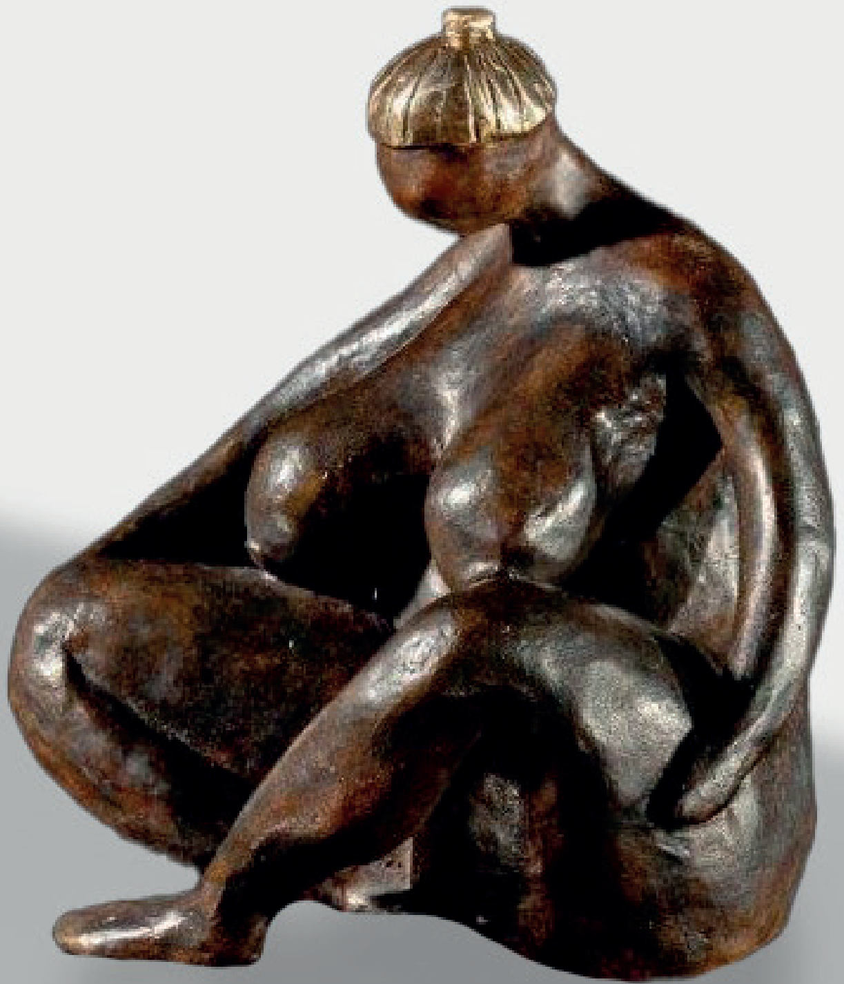
Annie Hamon - Délicata - Bronze (17cm)