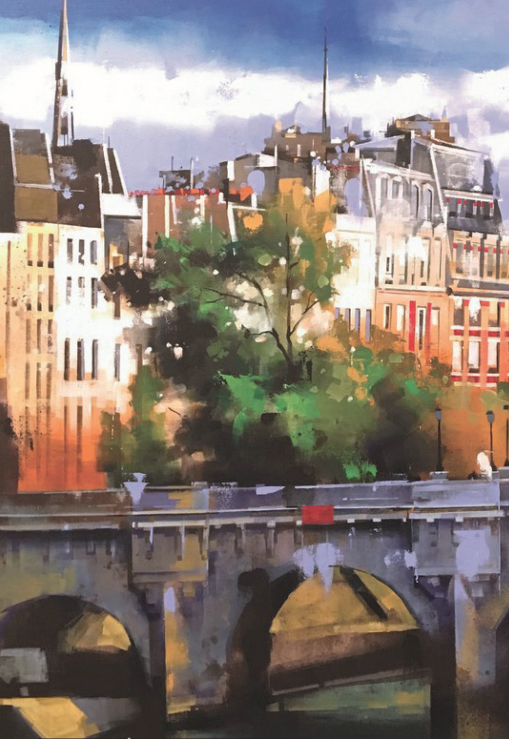
Yong-Man Kwon - Île de la Cité (Paris) (100*100)

Sous son pinceau rapide et acéré, les villes comme les objets du quotidien s’animent, se parent de lumière et semble palpiter sous le regard du spectateur nécessairement conquis. Artiste d’envergure, de renommée internationale, Yong-Man Kwon a reçu de nombreux prix et expose souvent.