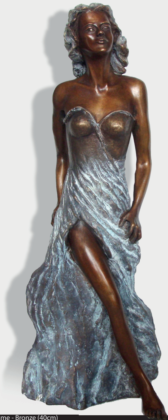
Annie Hamon - Dynamisme - Bronze (40cm)