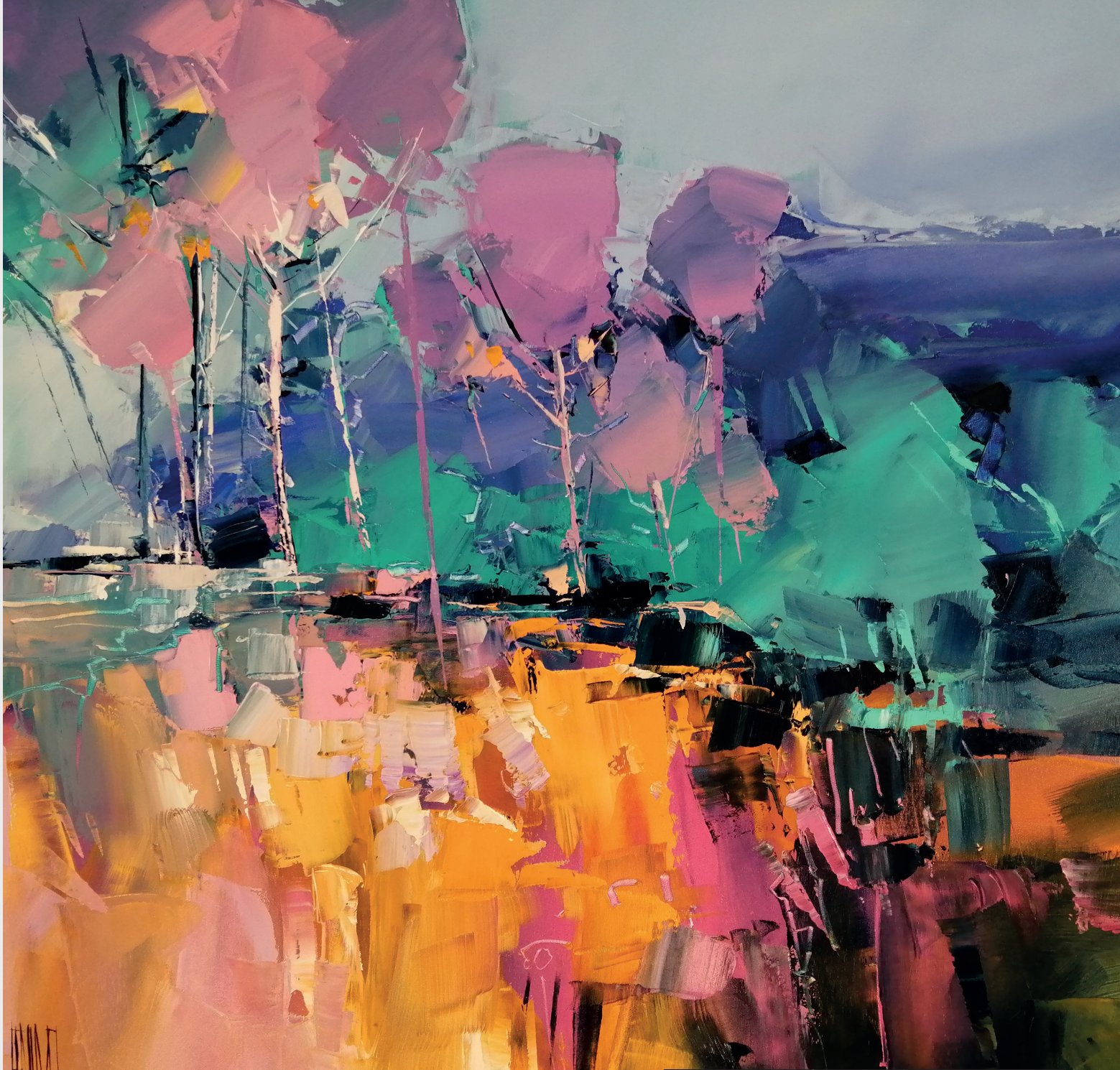
Hervé Lenouvel - La falaise aux sylvestres (80*80)