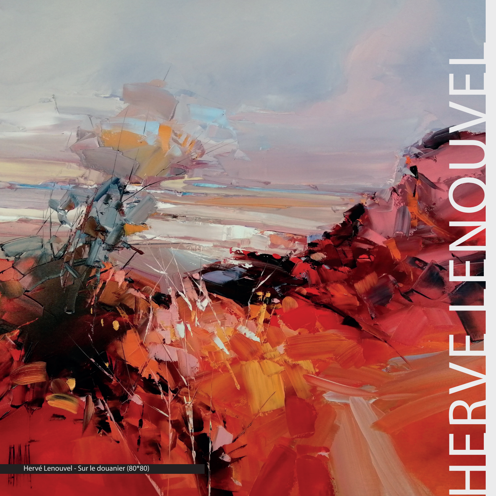
Hervé Lenouvel - Sur le douanier (80*80)