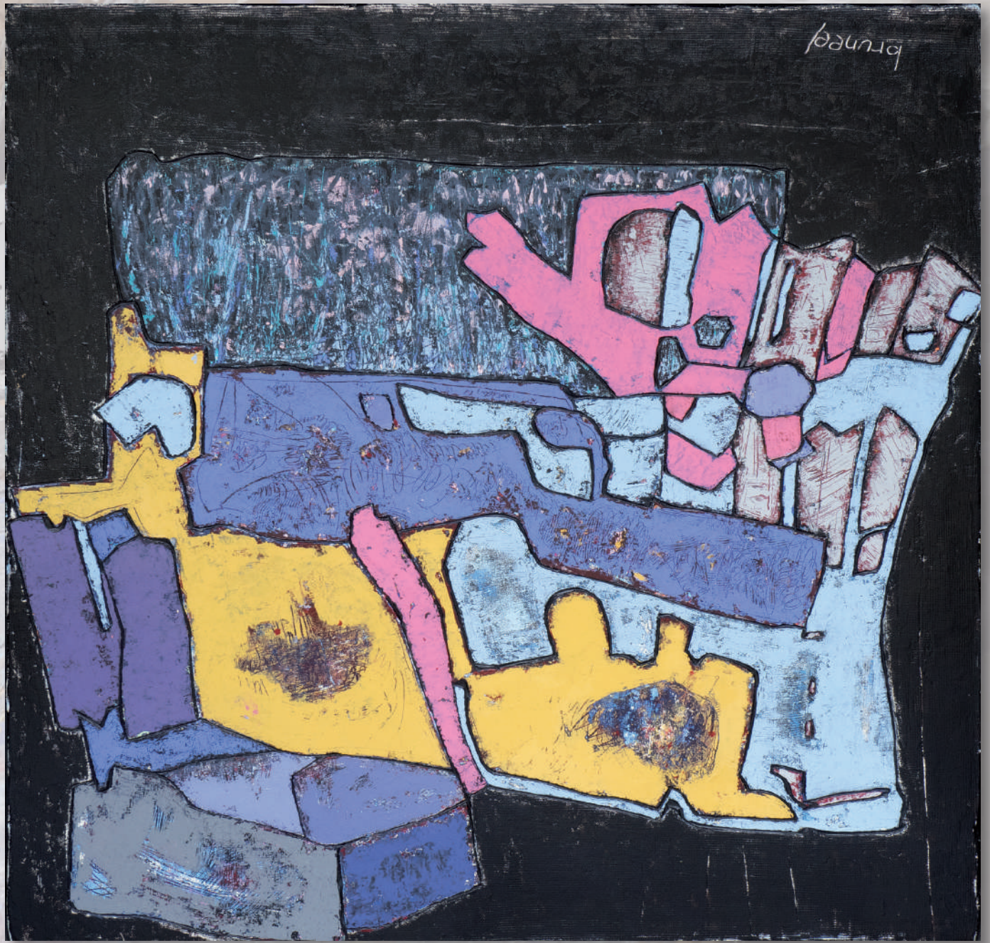
InteractionIV · 120x120