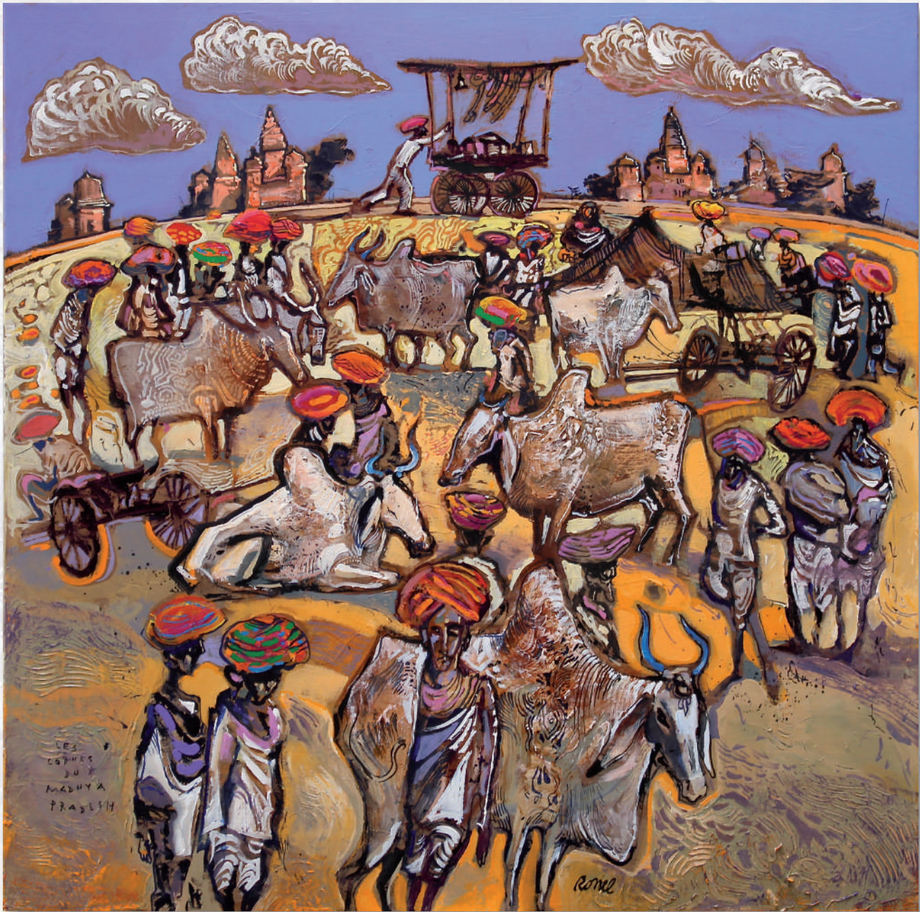
Les cornes du Madhya Pradesh - 80x80