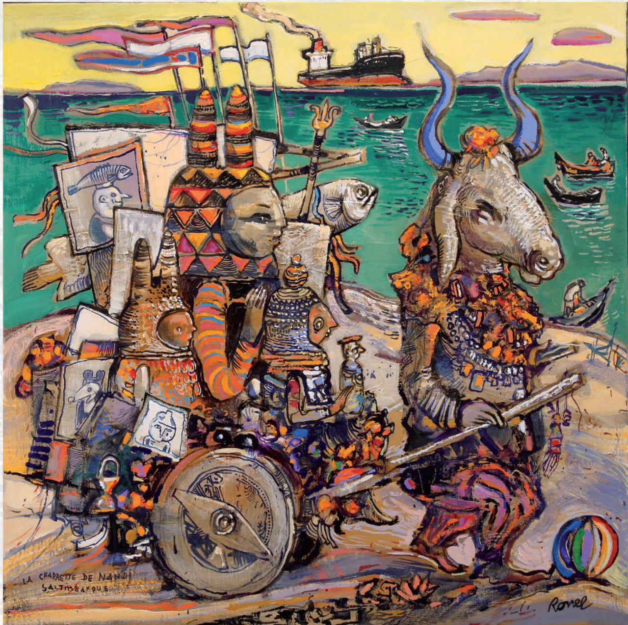
La charette de Nandi saltimbanque - 60x60