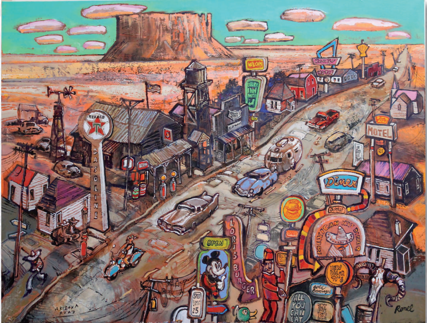
Arizona Road - 89x116