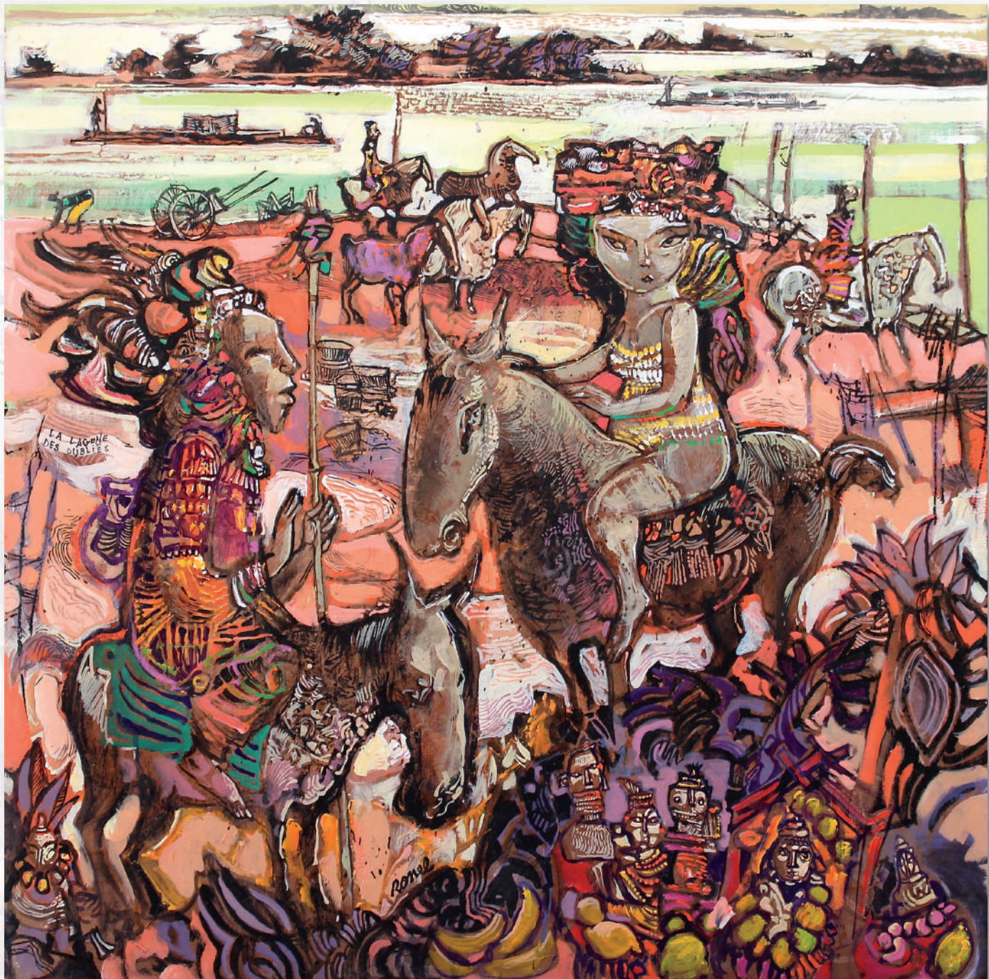
La lagune des oubliés - 80x80