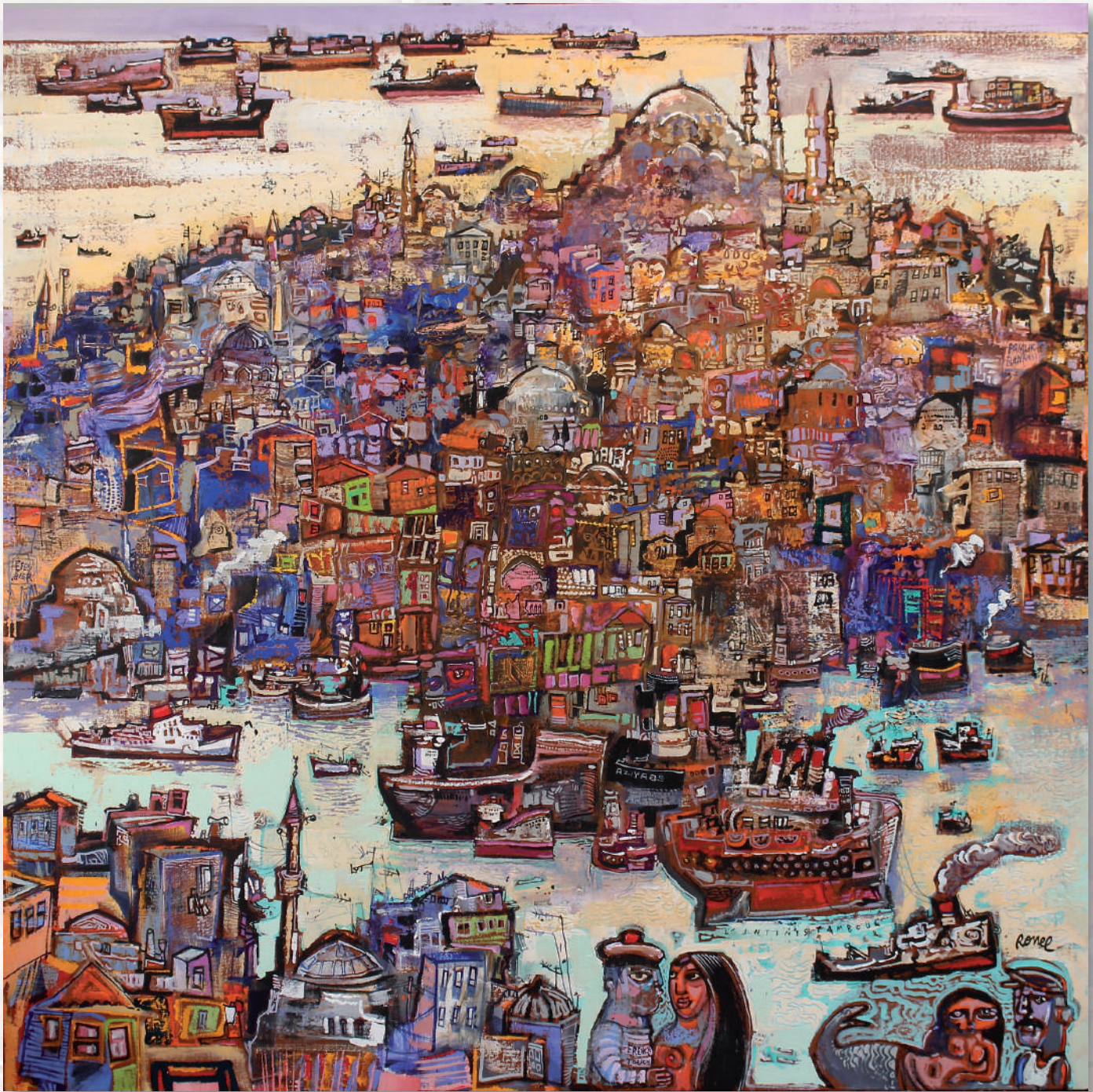
L 'infinistamboul - 120x120 9