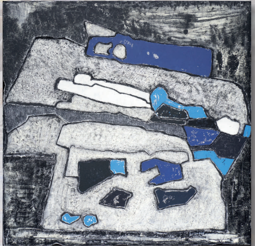
Interaction II - 120x120