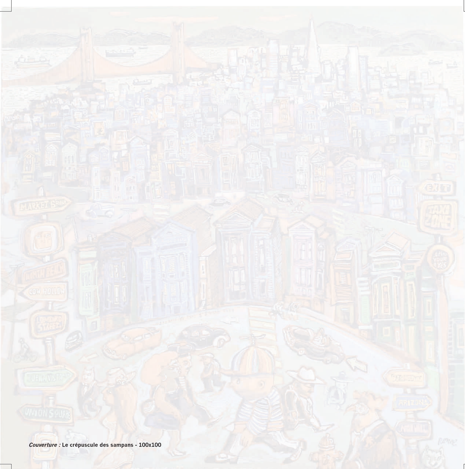
Couverture : Le crépuscule des sampans - 100x100