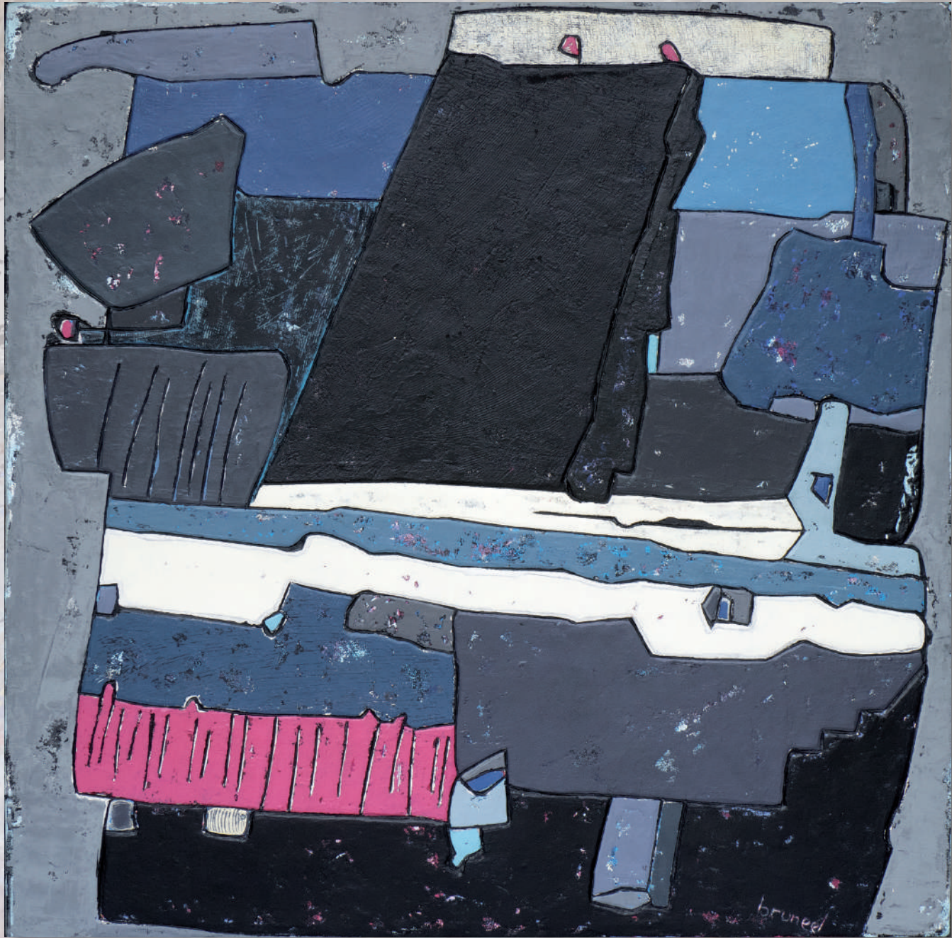
InteractionV · 120x120